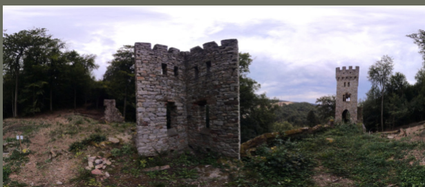
03 Ansicht der Karlsburg in Kugelprojektion und in Zylinderprojektion

Mit einer 360°-Panoramakamera lässt sich die Situation in einem Photo mit sphärischer Perspektive einfangen. Als Betrachter steht man quasi in der Szene. In einem Anzeigeprogramm für diese Art von Bild kann man die Blickrichtung frei bestimmen.