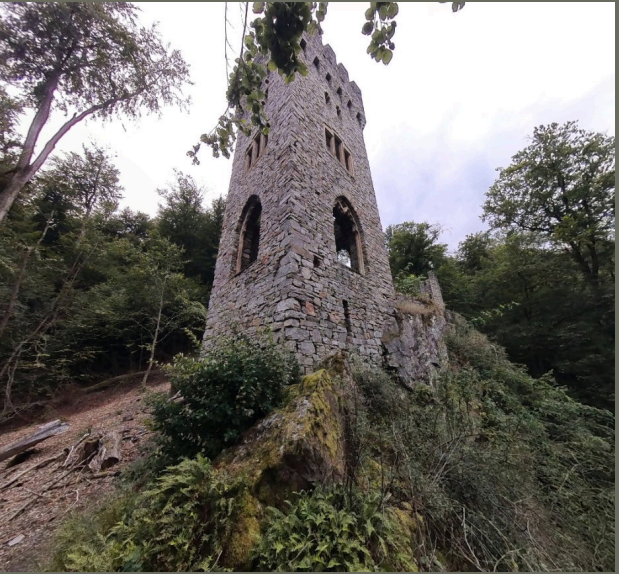
02 Turm der Karlsburg vom Felssporn aus gesehen

Die klassische Fotodokumentation ist nach wie vor die Standardmethode zur Dokumentation des Zustandes eines Objektes. Sie ermöglicht eine sehr genaue Momentaufnahme eines Ausschnittes des zu darzustellenden Gegenstandes.